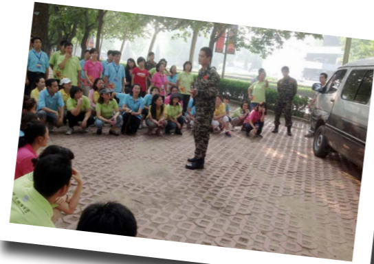
北京语言大学公共安全培训