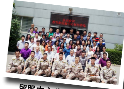
留服中心公共安全培训