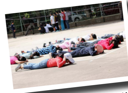
学生们练习安全防范基本技能