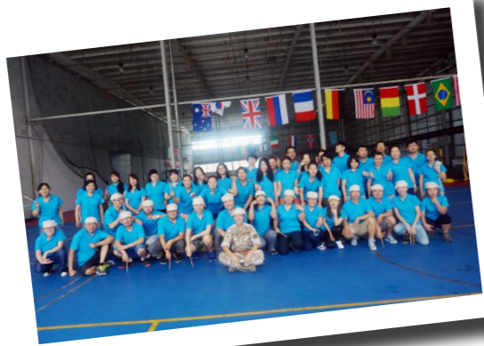
北京英国学校公共安全培训