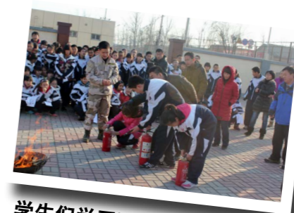
学生们学习灭火器的使用方法