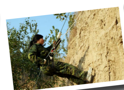
学生们进行野外逃生演习