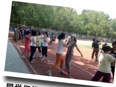
同学们相互练习个人防卫技巧