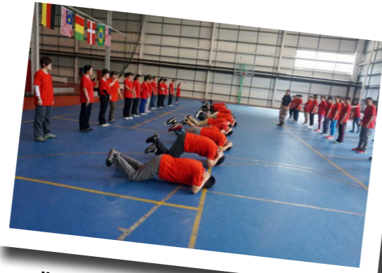
北京加拿大国际学校公共安全培训