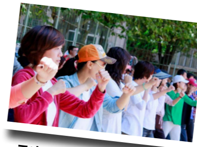
云南师范大学公共安全培训