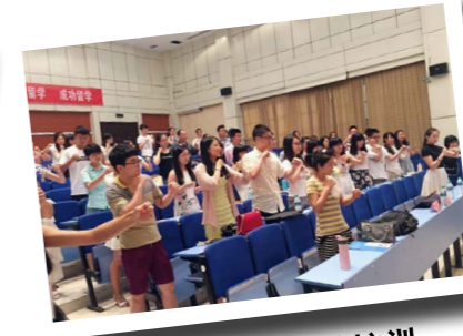
武汉大学行前培训