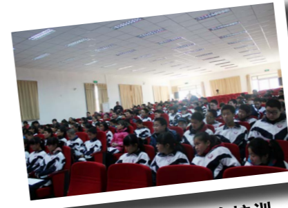
狼堡中学公共安全培训