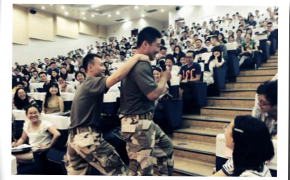
中国科学技术大学行前培训