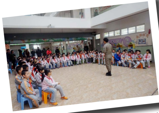
北京师范大学朝阳附属小学公共安全培训