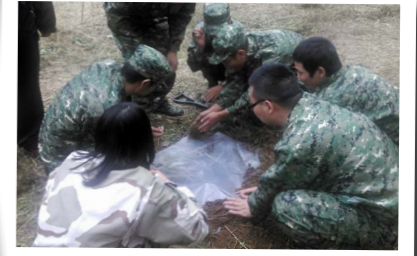
学员实践野外获取水源