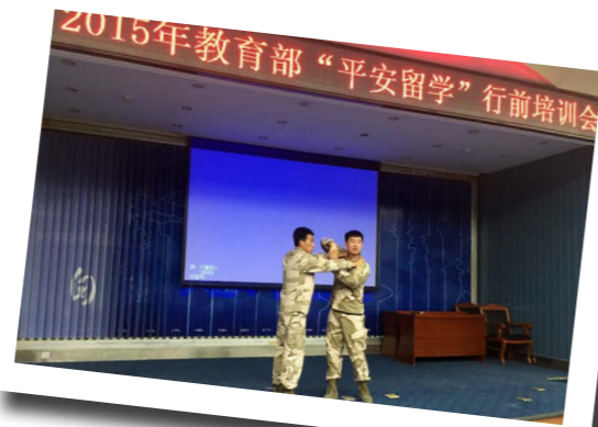
兰州大学出国留学行前培训